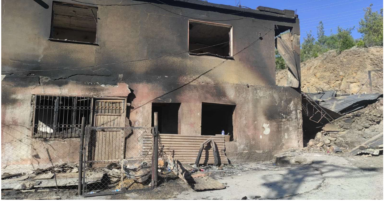
Aladağ Ormanlık Arazisi: